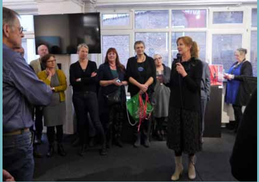
Opening door voorzitter