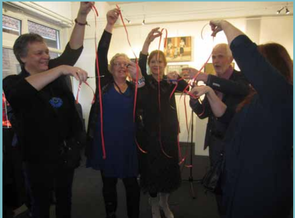
Lintjes knipen door het bestuur van AKKA samen met de voorzitter van F.A.